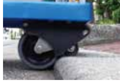
01.後輪が段差にあたる