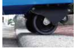
03.段差をスムーズに「乗り越える」