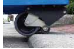
02.前輪が路面を押す力に変換