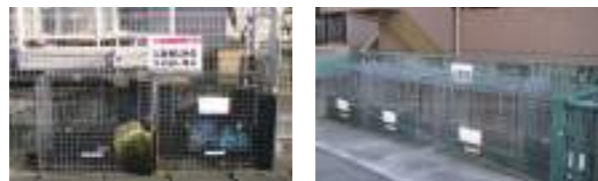
ゴミの散乱を防止します。