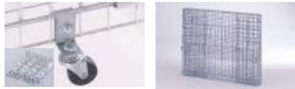
キャスター付き仕様(取付金具を使用)。折りたたんで省スペース化に貢献。

犬・猫・カラスなどからゴミを守るゴミステーションの決定版。軽量で折りたたみが簡単、持ち運びも容易です。溶融亜鉛メッキ(スズ合金メッキ)を採用しあらゆる環境でいつまでも美しく使用できます。