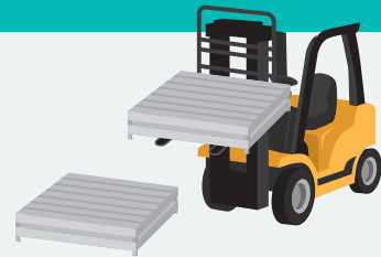
必要な時、必要な場所にサッと移動！