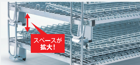
段積みブラケットあり