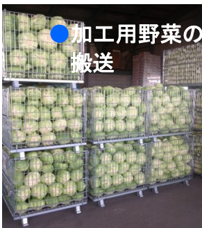
●加工用野菜の搬送